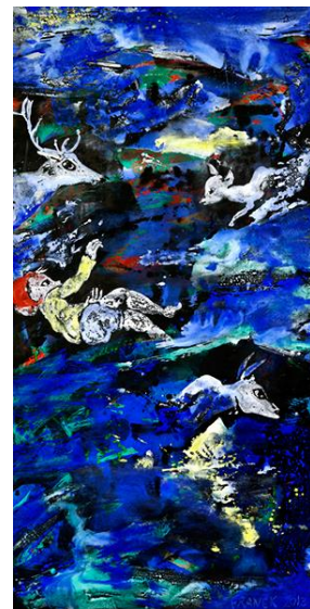
Hochwasser, 2013 © FRANEK | VG Bild-Kunst, Bonn 2021

Der Bilderkosmos der Berliner Künstlerin FRANEK ist unendlich: Tiere aller Art, Fabelwesen, Mischwesen und immer wieder Kinder bevölkern ihre Bildwelten. Es ist, als ob sie – mit Kinderaugen unterwegs in einer Nusschale über den Tiefen und Untiefen der Schöpfungsfluten – einmal die Enden des Himmels und der Erde bereist hätte, um Bilder zur Welt zu bringen. Es sind Gefährten der Träume – und der Alpträume. FRANEKs Fabelgestalten erscheinen wie Traumbilder auf der Schwelle zwischen Tag und Nacht, werden zu Gegenübern, Wiedergängern, Schreckgespenstern, Freunden mitten in unserer Zeit, mitten in einer verletzten Schöpfung. In der Wilmersdorfer Kirche Am Hohenzollernplatz werden sie lebendig.