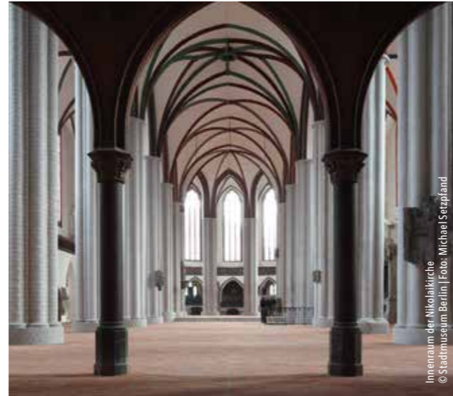
Innenraum der Nikolaikirche

Chiharu Shiotas Rauminstallation LOST WORDS regt zur Auseinandersetzung an: Wo befinden wir uns im Gespinnst der verlorenen Worte? Welche Geschichten prägen uns heute? Wie verändern sie sich in den weltweiten Migrationsprozessen? Und welche sind uns verloren gegangen? Dieser Assoziationsraum bietet begleitend zur Ausstellung auch für Schriftsteller, Musiker, Theologen, Philosophen und Soziologen viele Anknüpfungspunkte.